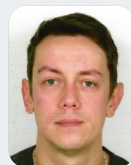
Salle des fêtes Loïc BEDEL