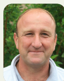
Stade Alex ZINDT