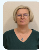
Etat civil - Cimetière - Grands anniversaires Isabelle GOEURY